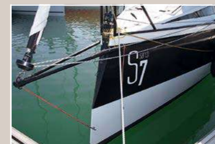
Pratique L'étrave est fine pour fendre le clapot méditerranéen. Le balcon fait office de chèvre grâce à un palan qui le fixe à l'étrave. Le bout-dehors est aussi basculant.