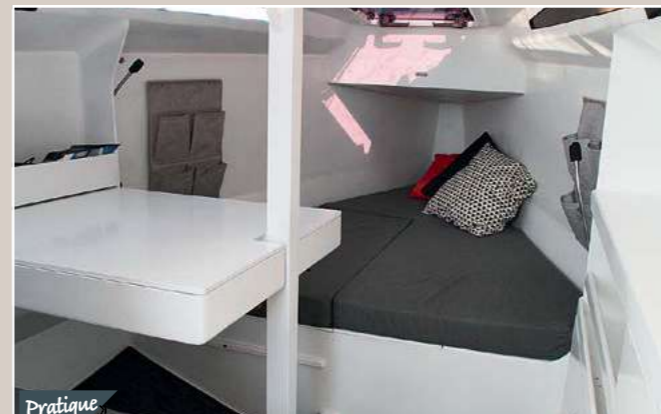
Pratique L'intérieur est sobre et astucieux : la table, à bâbord, peut se rabaisser et laisser place à un complément matelas.

Texte : Sidonie Sigrist.