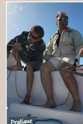
Pratique Les cale-pieds sont amovibles.