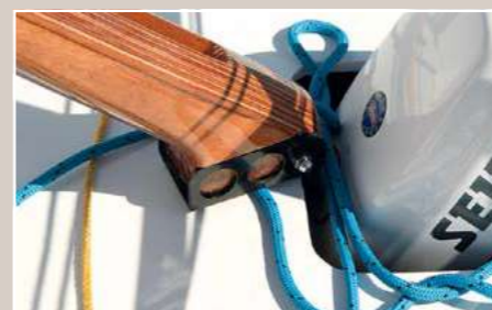
Pas pratique Le carré de barre est un piège pour les bouts. Si l'écoute de gennaker en continu s'y coince, l'empannage peut être compromis!