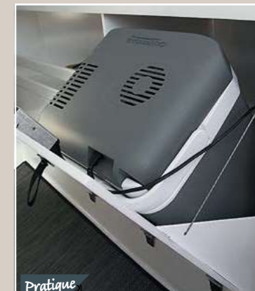
Pratique La glacière électrique garantit un peu de frais.